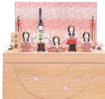
I02 安土雛五人(桐収納)